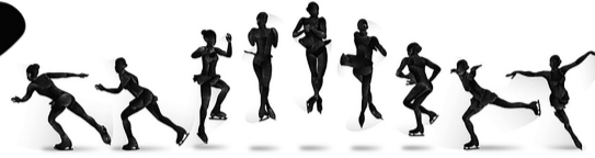
Один из сложных элементов фигуриста – лутц